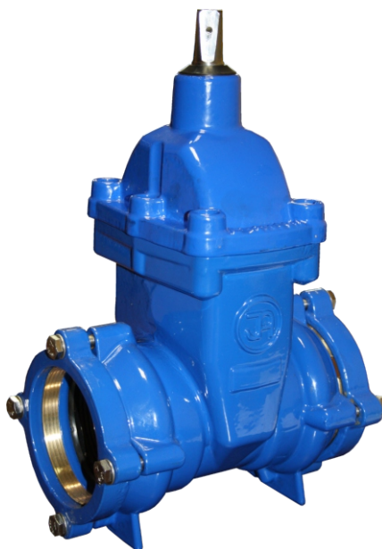
Na zdjęciu DN80

długość zabudowy wg rysunku klasa szczelności - A ciśnienie robocze PN16 Temperatura pracy do 120°C